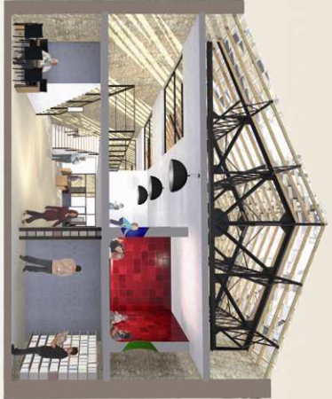
0,5 1 2 5m

Coupe perspective transversale A-A' de la bibliothèque