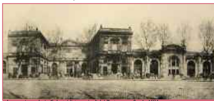
Les anciens chais Calvet (disparus), cliché Terpereau, fin du XIX e s.

Pour améliorer l'accès au port depuis l'arrière-pays, deux grandes voies rayonnantes à la courbe du fleuve furent ouvertes : le cours du Médoc (1865) et le cours de la Martinique (1896). Le cours du Médoc s'inscrit sur le terrain de l'ancienne raffinerie Larcher, détruite par un incendie en 1864. Les rives de ce large cours planté sont parsemées de chais, usines et distilleries dont l'architecture variée est tout de même dominée par le modèle à pignon ou fronton. L'éclectisme architectural et fonctionnel du cours du Médoc est caractéristique de toute l'architecture bordelaise de cette période et offre au paysage urbain un visage extrêmement varié, qui contraste avec la prétendue monotonie des voies haussmanniennes. L'absence remarquable de grands immeubles de rapport caractérise bien d'ailleurs la spécificité de ce cours ouvert en dehors de la vieille ville pour l'activité marchande du quartier des Chartrons.