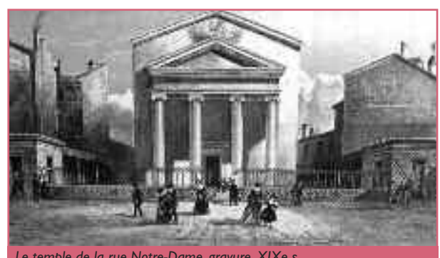
Le temple de la rue Notre-Dame, gravure, XIX e s.

En 1831, le préfet autorise la construction d'un temple protestant financé par les fidèles et la Ville. Le projet, dessiné par Corcelle, permet à la communauté protestante locale de quitter l'ancienne église des Filles de Notre-Dame en 1835. L'architecte tire parti des contraintes du parcellaire en lanterne des Chartrons, en distribuant avec dextérité les différents volumes. L'emboîtement de triangles du frontispice, lui-même englobé dans le mur pignon, est couronné d'une corniche supportant l'unique décor sculpté de la façade : une bible ouverte d'où partent des rayons fendant les nuées et sous laquelle on peut lire « Dieu est Esprit, et il faut que ceux qui l'adorent, l'adorent en esprit et en vérité » (Jean 4 : 21-24). Le parvis du temple était initialement marqué par un portail de fonte relié par une grille à deux pavillons gracieux, aujourd'hui détruits. Le temple des Chartrons marqua durablement la présence de la communauté protestante dans ce quartier marchand.