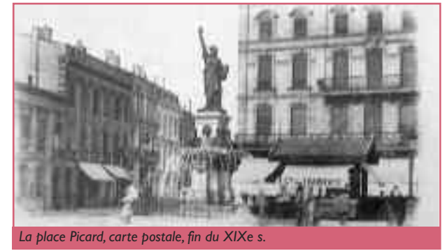
La place Picard, carte postale, fin du XIX e s.

La place Picard, à la forme si caractéristique et triangulaire d'une patte d'oie, naît à la rencontre de l'aménagement de deux cours du XVIII e siècle : le prolongement du cours de Verdun, aujourd'hui cours Portal, et le cours Balguerier-Stuttenberg (ancien chemin du Roi). La place ne prend véritablement forme qu'au début du XIX e siècle et est initialement baptisée place Saint-Louis. Ce patronyme provient du projet de construction d'une nouvelle église Saint-Louis sur sa rive ouest, au milieu du XVIII e siècle.