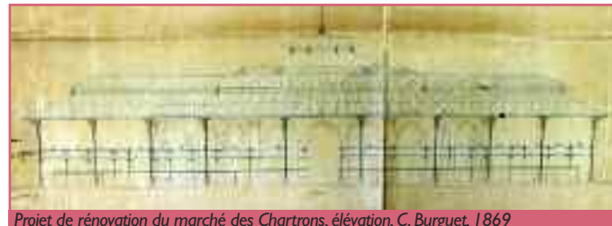
Projet de rénovation du marché des Chartrons, élévation, C. Burguet, 1869

Lorsque Charles Burguet dresse l'état des lieux de ce marché en 1869, c'est une halle octogonale dont chaque côté s'ouvre par trois arcades en plein cintre. Une haute balustrade somme l'ensemble ; le rez-de-chaussée doriques en marquent les angles. Le marché est couvert d'une charpente métallique légère couronnée au centre d'un lanterneau. L'architecte municipal imagine un projet d'agrandissement composé d'une galerie prenant appui sur les murs de pierre de l'octogone d'une part et sur des piliers de fonte à chapiteau