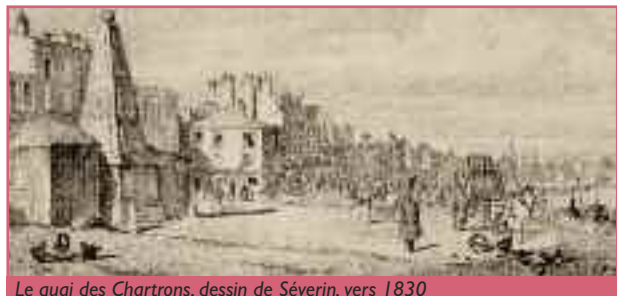
Le quai des Chartrons, dessin de Séverin, vers 1830

La création du Jardin Public par l'intendant Tourmy commence à relier le faubourg au reste de la ville. Une façade rectiligne sur le quai vient s'inscrire dans le prolongement de la grande façade du port de la Lune. L'intégration du faubourg dans la ville s'achève par l'érection du lotissement des Quinconces, à partir de 1819.