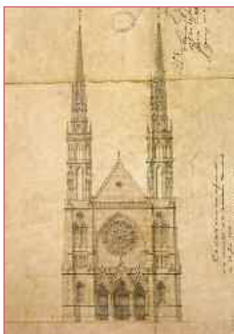
Projet de reconstruction de l'église Saint-Louis des Chartrons, élévation, C. Brun, 1862

La nouvelle église Saint-Louis, construite entre 1874 et 1879 par