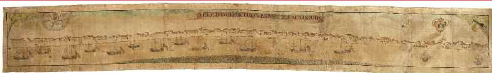
Vue du fameux faubourg », perspective, 1741