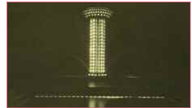
La fontaine lumineuse de la place Paul-Doumer, photographie, début XX e s.