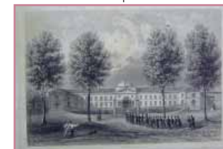
Le petit séminaire (lithographie d'A. Bordes)

Ce bâtiment aujourd'hui occupé par le lycée Gustave Eiffel est l'ancien dépôt de mendicité de Bordeaux, devenu ensuite