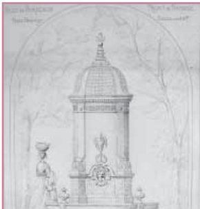
La fontaine de la place Nansouty (L. Garros, arch., 1865)

les croissants de la ville. Un jeu de motifs variés composés chacun d'un mascarone et d'une cigogne orne la partie centrale. Cette fontaine fait partie d'un vaste programme d'alimentation en eau engagé au Second Empire, en même temps que l'installation des fontaines de la place Charles Gruet et du Parlement notamment.