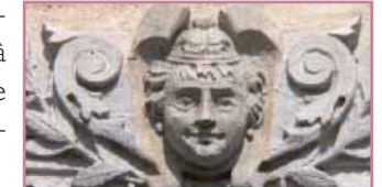
Mascarone, rue de Galard

La répétition des travées, la continuité de la modénature et la diversité des décors des façades se combinent à un traitement de qualité de l'espace public : le pavé de la chaussée et des revers de trottoir, les caseroles de cuivre suspendues à des patères, maintiennent une ambiance authentique et charmante dans cette rue.