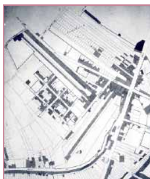
Le quartier du Serporat et des corderies (atlas de Béro, v. 1830)