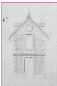
Élévation du poste d'octroi de la barrière de Toulouse (C. Burguet, arch., 1866)

Aux confins du territoire communal avec Bègles, la ville fut agrandie par l'annexion d'une partie de cette commune en 1865 et le grand boulevard de ceinture en marqua dès lors la limite physique, mais aussi fiscale, à l'angle des grandes voies rayonnantes. Barrière de Toulouse, un poste d'octroi fut installé en 1866 sur les plans et devis de Charles Burguet, architecte municipal. Cette modeste guérite de brique et chaînes de pierre, est couverte d'un toit saillant