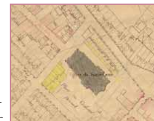
La place du cardinal Donnet (extrait du cadastre, 1883)

Cette nouvelle paroisse s'organise autour d'une place qui porte le nom de son bienfaiteur, le cardinal Donnet. Elle est consacrée par le culte du Sacré-Cœur avec le soutien puissant de l'archevêque et du vicaire de Saint-Michel.