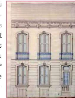
Exemple type de l'élévation d'une maison à étage de trois travées (rue Pelleport, 1881)

Les lotissements composés par les rues de Sauternes, Jean-Dumas, Vaucher, Pierre-de-Ladime..., autour de la caserne, offrent un autre exemple remarquable des quartiers d'habitat populaire et de l'architecture domestique locale. Ces rues présentent des alternances de maisons de rez-de-chaussée ou d'un étage où des règles communes, la variété de besoins de chaque propriétaire, le talent et l'entrepreneurs réalisent ces maisons tout au long de la seconde moitié du XIX e siècle jusqu'à la seconde guerre mondiale. Ces conditions meurent et se perdent.