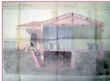
Coupe sur une échoppe double, rue de la Pyramide (Pelleport, 1865)

Toute la petite banlieue de Bordeaux se caractérise par ces quartiers d'échoppes et de maisons à étage qui font le paysage ordinaire de la « ville de pierre ». Dans les quartiers sud, plusieurs ensembles remarquables sont constitués autour du développement de la gare, de la caserne, et des activités économiques de ces quartiers.