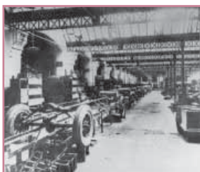
Chaîne de construction de l'usine Ford, atelier D (v. 1920)

Cet ensemble, l'usine - désormais désaffectée par les locaux du centre de formation des apprentis - et les quartiers d'habitat qui l'entourent, demeure un témoignage tardif de toute l'activité industrielle et laborieuse des quartiers sud de Bordeaux, qui, vus d'un peu plus près, méritent que l'on s'arrête un moment sur leur identité et leur histoire.