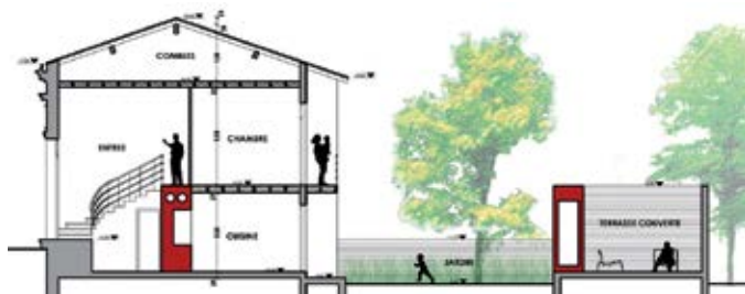
Exemple de plan de coupe (état projeté)

4 Un plan de coupe précisant l'implantation de la construction par rapport au profil du terrain.