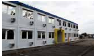
Une partie du site est déjà en friche.