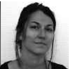
Agence François Leclercq, Architectes Urbanistes François Leclercq, Lionel Wheeler, Annabel Casses