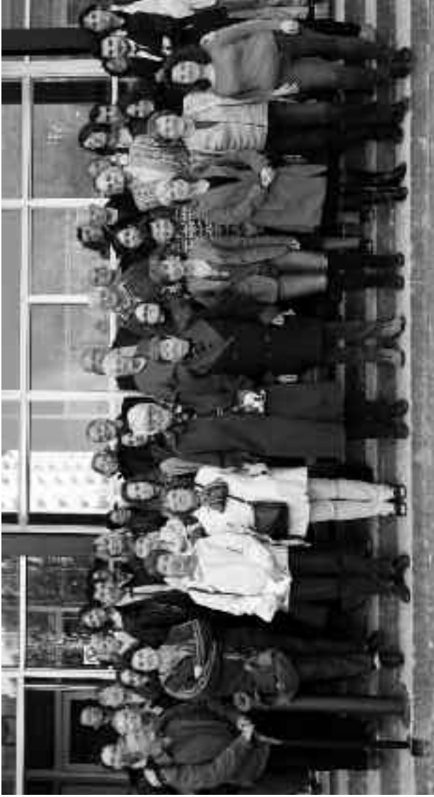
Le groupe de travail « salle des fêtes » 4 avril 2012