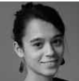
Collectif ETC Kelly Ung