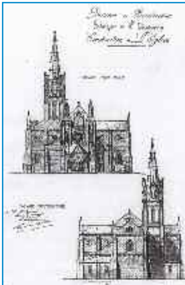
Projet pour la construction de l'église Saint-Augustin, 1875 (Dessin F. Boudy d'après AMB XVI C 1-2)

En l'espace de soixante ans, le hameau du Tondu est devenu le centre d'un nouveau village avec son église et son école primaire. Peu de temps après, ces équipements de proximité sont complétés par la construction de la mairie annexe avec sa salle des fêtes.