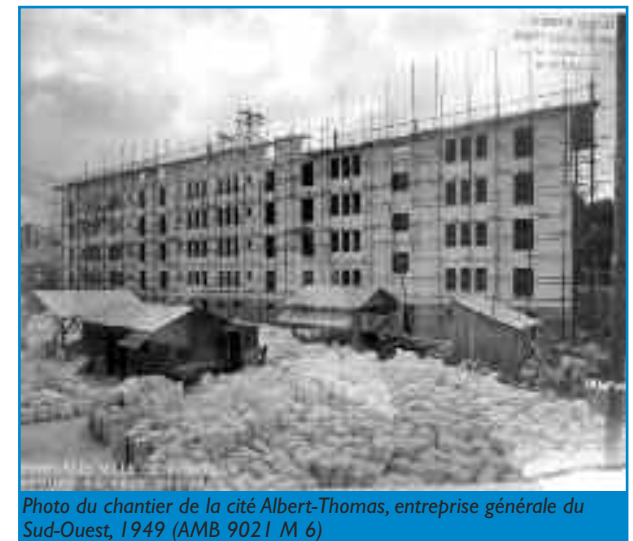
Photo du chantier de la cité Albert-Thomas, entreprise générale du Sud-Ouest, 1949 (AMB 9021 M 6)

une longue barre unique implantée en très léger retrait de la rue et qui délimite un jardin collectif à l'arrière. Sur la seconde, trois barres d'un, deux et trois blocs respectent cette même implantation, délimitant un autre jardin et laissant ouvert les angles des rues Léo-Saignat et Mestrezat avec la rue Albert-Thomas. D'une architecture et construction soignée, ces bâtiments offrent une incontestable qualité de vie grâce à l'équilibre entre modernité et tradition que propose l'architecte.