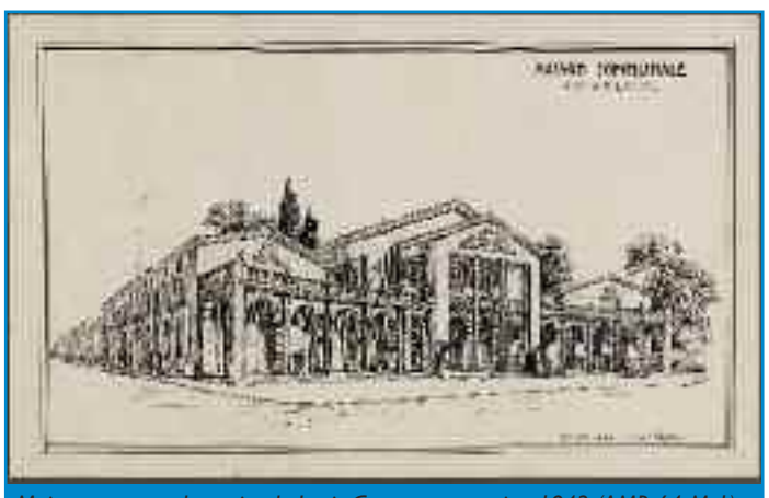
Maison communale, projet de Louis Garros, perspective, 1942 (AMB 64 M 1)