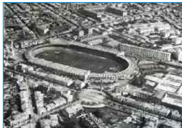
Vue aérienne nord-est, atelier Microfilm [1950] (AMB XVI F 22)