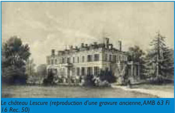
Le château Lescurre (reproduction d'une gravure ancienne, AMB 63 Fi 16 Rec. 50)