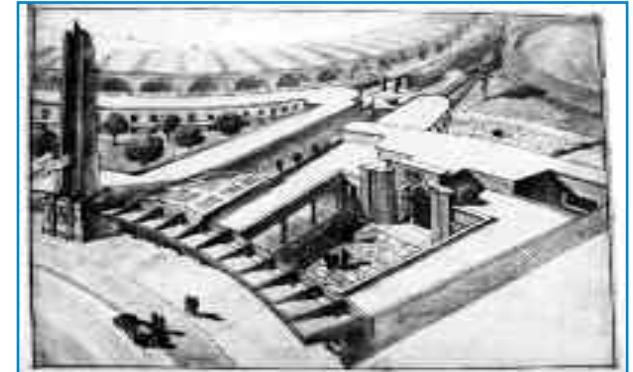
Centre municipal d'athlétisme, rue cavalière de Jacques d'Welles, 1938 (AMB XVI F 106)

reçues et la remise des prix aux 5 équipes lauréates a eu lieu le 10 juin 2013. Les résultats de cet appel à idées permettent de réfléchir au devenir de l'ancien stade, à l'horizon 2015.