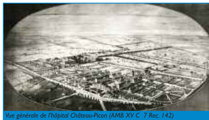
Vue générale de l'hôpital Château-Picon