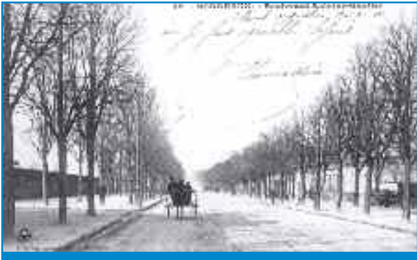
Le boulevard Antoine-Gautier (carte postale ancienne, archives privées)

Saint-Augustin, quartier de grands domaines aux voies sinueuses l'ingulant d'est en ouest, n'a amorcé son urbanisation que dans la seconde moitié du XIXe siècle. Le 6 juin 1853, le négociant Johnston et le fabricant des cartes à jouer Héron cèdent des terrains à la Ville de Bordeaux pour la réalisation d'une première portion des boulevards de ceinture, d'une largeur de 34 m, entre le chemin d'Arès et celui du Tondu, ainsi que pour l'extension du cimetière de la Chartreuse. Un poste d'octroi est créé à la nouvelle barrière d'Ornano. Ainsi, la rue d'Ornano, dont une première section est issue du prolongement de la rue des Frères-Bonnie dans le lotissement de Méziadeck, dès 1780, est prolongée après 1853 afin de relier en ligne droite le centre ville à ce nouveau quartier de la barrière.