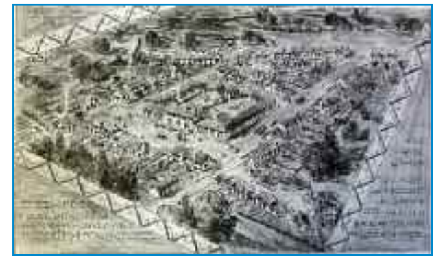
Vue de vol d'oiseau de la cité Robejot (Loucheur), J. d'Welles, architecte, 1927 (AMB 9002 M 1)

Connue sous le nom de cité Loucheur, cet ensemble est formé en réalité de trois rues créées entre 1928-1929 par Jacques d'Welles sur ce terrain issu d'une maison de campagne dont l'édifice principal est maintenu sur la rue de la Béchade. La cité Jules-Badel est la principale, orientée nord/sud, elle traverse le terrain dans la longueur et présente sur sa face est des retraits d'alignements ainsi qu'un accès en profondeur, par l'impasse Marrakech, à cinq maisons en bande et une isolée. Les cités Marcel-Issatier et Géo-Delvaile forment un plan en U qui contourne l'ancienne maison et desservent les maisons de part et d'autre de l'école. L'originalité de ce programme est de comporter, au cœur de la cité, une école communale, également bâtie par d'Welles.