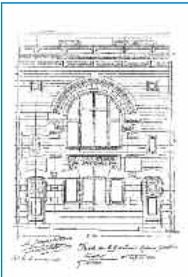
Façade de la maison atelier de Gaston Adoue (AMB 50 O)

1900 des échoppes et des maisons de ville qui se complètent, dans les années 1930, de belles maisons Art déco à porche et garage tout à fait comparable à celles du lotissement Lescurre. L'architecte Téoulé conçut notamment, en 1936, la maison de ce propriétaire lotisseur.