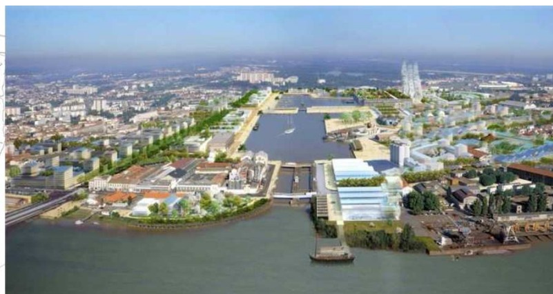
© Ville de Bordeaux/ Agence Nicolas Michelin