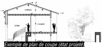
Exemple de plan de coupe (état projeté)

● Un plan de coupe (avec état initial et état futur) précisant l'implantation de la construction par rapport au profil du terrain lorsque les travaux ont pour effet de modifier le profil du terrain.