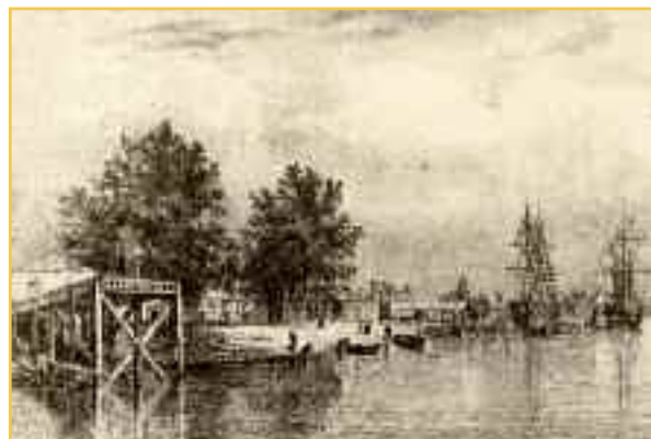
Le quai de Bacalan devant le magasin des vivres, dessin de Séverin, lith. de Lège, XIX e siècle (Mémoire de Bordeaux).

La machinerie des pompes est de type Westinghouse, le circuit hydraulique a été conservé et le remplissage et la vidange se font toujours par un canal qui se déverse dans le bassin à flot. L'édifice abritant la machinerie, ainsi que sa remise, sont des constructions modulaires en pans de fer à hourdis de brique, typiques d'un modèle créé en 1881 par l'architecte du Port Pierre-Charles Brun. L'ensemble a été inscrit à l'inventaire supplémentaire des monuments historiques en 2008.