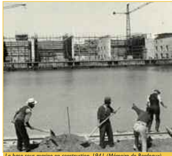
La base sous-marine en construction, 1941 (Mémoire de Bordeaux).

Un des aspects les plus singuliers de l'occupation fut l'activité très particulière qu'elle donna au port de Bordeaux. La Kriegsmarine y installa, avec la collaboration de l'organisation Todt, une base de sous-marins à l'épreuve des plus gros bombardements. Début 1941, la construction de l'U-Bunker commença, sous la direction de l'amiral Angelo Parona. L'Organisation Todt employa 2500 prisonniers ou requis (Français, Russes, Espagnols, Portugais...) Achevé en 1943, le bunker occupe un parallélogramme de 235 par 162 mètres et 22 mètres de haut. La tour annexe de 58 par 73 mètres à 27 mètres de hauteur. Au nord-ouest, un autre bunker abrite des cuves à mazout. Mais c'est l'U-Bunker qui demeure le plus monumental, avec son toit de 7 mètres d'épaisseur reposant sur des poutrelles d'acier et ses onze alvéoles munies de deux ponts roulant, pouvant accueillir 15 vaisseaux. En octobre 1942, la B.S.M. put accueillir les premières flottilles. 197 missions furent accomplies, ce qui représente 97 navires coulés avec un total de 526.976 tonnes jusqu'à ce que la base soit abandonnée, fin août 1944.