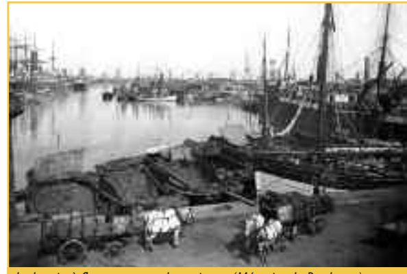
Le bassin à flot, carte postale ancienne.

Dès le XVIII e siècle, les tentatives ont en effet été nombreuses pour créer des docks à Bordeaux. Le décret impérial du 26 juillet 1867 a finalement autorisé les travaux à Bacalan. Les plans, adoptés en 1868, prévoyaient d'abord un seul bassin complété d'un réservoir d'alimentation. D'une surface de 8 ha, présentant 1700 m de quais pour 70 navires, deux écluses de 13 et 22 mètres de large permettent encore le passage de bateaux de toutes sortes. Les ingénieurs en chef des Ponts et Chaussées Joly de Boissel, La Roche-Tolay et Régnauld élaborèrent ce projet dont les travaux débutèrent en 1868. Le premier bassin inauguré en 1879 fut achevé en 1882. Des docks furent construits auprès en deux séries de bâtiments parallèles : le magasin aux laines, en 1879, et la halle métallique (1881-1885), entre lesquels s'implanta un vaste dépôt de charbon. La capacité d'accueil du port de Bordeaux passa ainsi, à la fin du XIX e siècle, de 4 à 6 kilomètres.