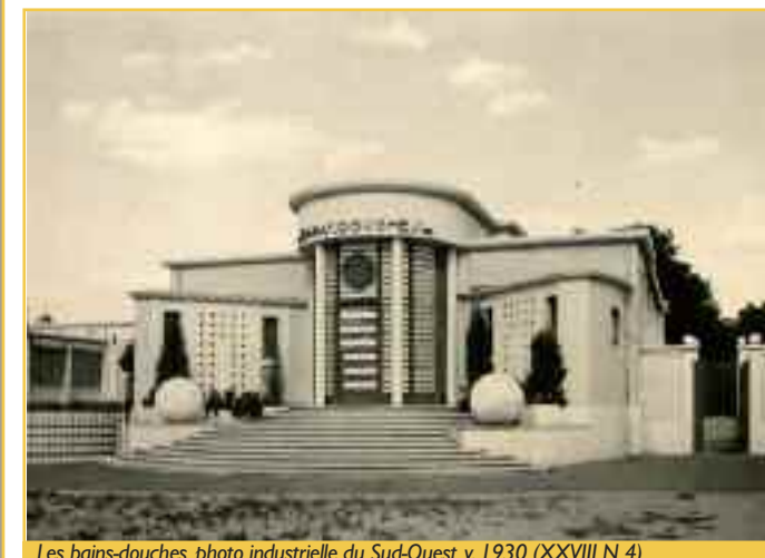
Les bains-douches, photo industrielle du Sud-Ouest, v. 1930 (XXVIII N 4).

L'aménagement de la place Adolphe-Buscaillet permit l'implantation d'un complexe comprenant une crèche, un dispensaire et des bains-douches. Cette opération fut décidée par la municipalité d'Adrien Marquet. Pierre Ferret fut chargé du projet en 1930. Le bâtiment fut inauguré en 1937. Que de changements avec les premières esquisses ! Au fond de la place, Ferret disposa deux pavillons. L'esthétique moderne l'a emporté : lignes droites, courbes des entrées, les seuls éléments décoratifs sont les grilles de fer forgé et le médaillon réalisé par sculpteur Binquet, présentant dans un style Art déco les armes de Bordeaux, ainsi que les bas-reliefs représentant des jouets. En 1939, comparés aux établissements de même type, les bains-douches de Bacalan étaient les plus grands et les plus beaux de la ville. La municipalité Marquet avait ainsi affiché la modernité et l'hygiène que'elle souhaitait insuffler dans les quartiers populaires.