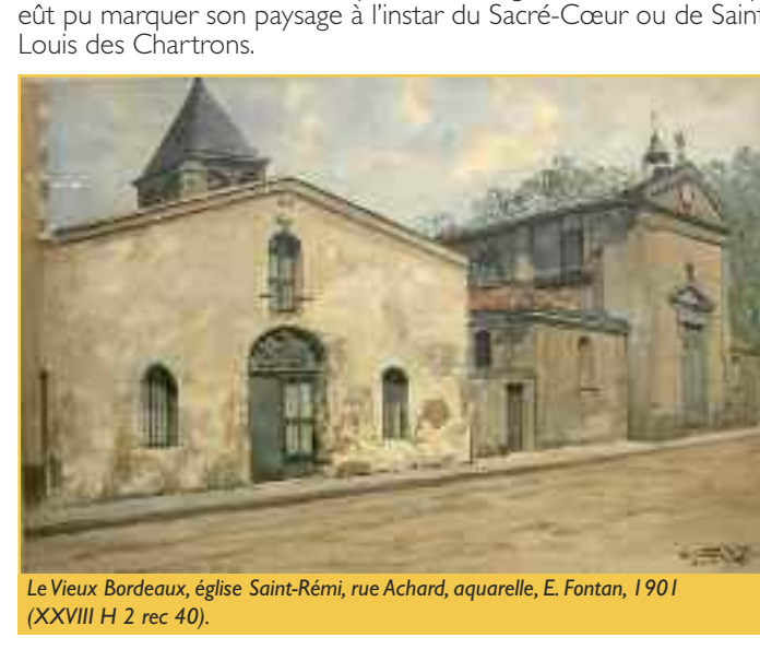
Le Vieux Bordeaux, église Saint-Rémi, rue Achard, aquarelle, E. Fontan, 1901 (XXVIII H 2 rec 40).

Bien qu'un projet de 1903 dressé par Henri Rille en décide la reconstruction, en version monumentale, Saint-Rémi est restée la modeste église qu'elle était au Second Empire. Ainsi le quartier de Bacalan n'a-t-il jamais disposé d'une église monumentale qui eût pu marquer son paysage à l'instar du Sacré-Cœur ou de Saint-Louis des Chartrons.