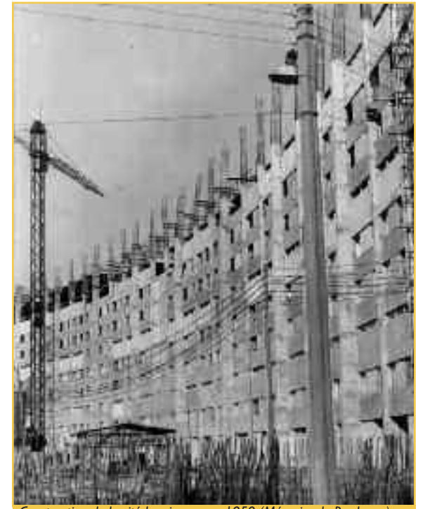
Construction de la cité lumineuse en 1959 (Mémoire de Bordeaux).

Grâce au financement Logeco (logements économiques et familiaux), le plan du ministre Pierre Courant insufflé un nouvel élan à la reconstruction. Dès 1953 on envisage, à Bacalan, la création d'une nouvelle cité. Jusqu'en 1956, cinq projets au moins sont étudiés. On s'éloigne peu à peu de l'idée d'un quartier d'habitation pour se diriger vers un monument phare. En effet, le dernier projet, en mai 1956, ne comporte plus qu'un seul immeuble de quinze étages accueillant 360 logements. Les polémiques vont bon train sur l'intérêt d'édifier à Bordeaux des immeubles de grande hauteur. Le maire, Jacques-Chaban Delmas, convaincu par les théories de Le Corbusier sur la ville moderne, peut alors affirmer : « Je vous demande de tourner vos yeux vers l'avenir et de ne pas regretter l'échec qui restera, bien sûr encore, longtemps dans Bordeaux, pour la raison que l'on ne peut