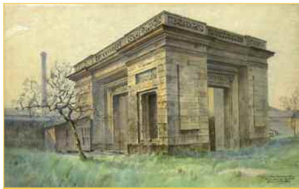
Le vieux Bordeaux, pavillon Louis XVI rue Achard, aquarelle, E. Fontan, 1913 (XXVIII E 2 rec 40).

La fabrique de jardin qui subsiste aujourd'hui à l'état de vestiges dans les locaux de l'entreprise Decaux, est située sur l'ancien domaine de La Croix-Marion. Le pavillon aurait été construit vers 1780 et son nom de Richelieu vient peut-être de ce que M. de Pontet, grand seigneur, recevait dans sa maison de plaisance ce célèbre gouverneur. Le pavillon se situait à l'origine en bordure de Garonne, sa façade principale ouvrait sur le fleuve. Il est depuis, comme le magasin des vivres, éloigné de la rivière. Cette mutation du territoire du quai de Bacalan commença en mai 1837 où le domaine fut vendu pour être transformé en chantier naval.