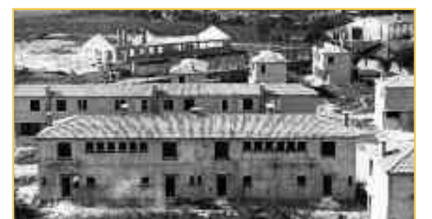
Les maisons du « village Claveau » en 1953.

La crise du logement frappa durement Bordeaux après-guerre. La reconstruction de cités nouvelles fut nécessaire, d'autant que le quartier Mériadeck, déclaré insalubre en 1950, fut progressivement détruit, ce qui accentua encore le besoin de logements neufs. Le premier projet de d'Velles et Royer, en 1950, prévoyait 594 logements et huit boutiques. La réalisation fut fort différente. La municipalité récupéra la salle des fêtes et la piscine laissée par les Allemands. Deux groupes scolaires