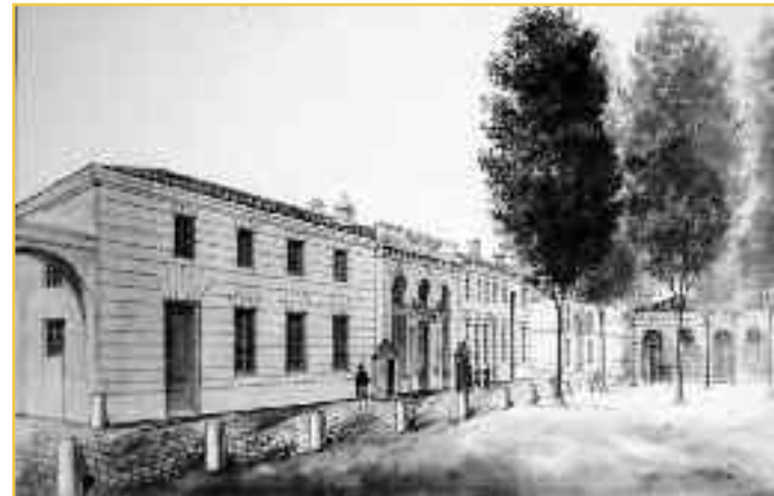
Les magasins vus de la place Raulin, dessin XIX e siècle (XXVIII D cl 2636).

Pour la Marine, l'ingénieur Joseph Teulère a dessiné en 1785 le gigantesque établissement des vivres. Sa destination était la fabrication, le conditionnement et le stockage des denrées de la marine royale. Les locaux immenses (plus de 25 000 m 2 ) étaient distribués autour de cinq grandes cours. La plupart, bâtis d'un matériau médiocre, ne présentaient pas d'intérêt esthétique, si ce ne sont leurs extraordinaires charpentes. La partie centrale du bâtiment d'entrée sur la rue Achard formait, avec les deux pavillons au-devant, une cour ouverte sur le fleuve avant que les bords de Garonne ne soient colmatés et élargis, à cet endroit, de 150 m environ vers l'Est. L'avant-corps combine des baies en plein-cintre et rectangulaires surmontés d'un fronton triangulaire. L'ensemble marqué de profonds refends est sommé d'un attique où figure la vignette qui ornait les papiers de l'amirauté. Les pavillons aux murs à bossages alternent baies en plein-cintre et oculi. Ils sont plus tardifs que le bâtiment principal. Ils servaient de tuerie pour le bétail et un atelier spécial fut affecté à la préparation des viandes et des tablettes de bouillon pour les marins malades à bord des navires de l'Etat. Les deux pavillons restaurés sont occupés par les artistes qui animent ce lieu renommé "Les Vivres de l'art".