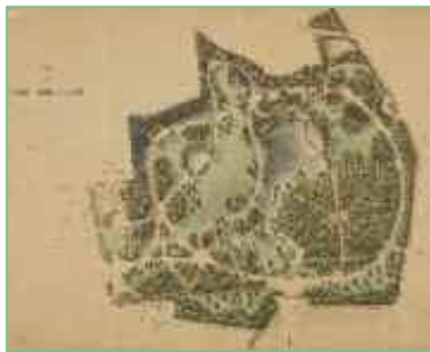
Plan du Parc Bordelais, E. Bühler, 1884 (AMB XVIII C.2 / 26 PP 35)

Un grand jardin fut créé en lieu et place du domaine Cutler, parc et jardin d'acclimatation qui fut racheté par la Ville de Bordeaux en 1879 et inauguré en 1888. Le parc Bordelais est une création d'Eugène Bühler qui multiplia la mode des jardins paysagers à la fin du XIX e siècle. Le paysagiste utilisa beaucoup le parc déjà existant pour en créer un nouveau. Ainsi, la pièce d'eau centrale forme thalweg et donne de la profondeur au jardin. La garenne fut réutilisée et confortée, avec ses grands arbres de haute futaie qui offrent couvert et verticalité. Enfin, la colline, traitée en belvédère sur le lac, domine le site. Plusieurs constructions du parc ancien furent conservées et de nombreuses fabriques neuves installées : pont, réservoir, abri à voitures, exèdre... et bien sûr un incontournable kiosque à musique pour les représentations dominicales de la fanfare municipale si prisées à la fin du XIX e siècle. Ce parc a fait l'objet d'une restauration récente conduite par l'architecte-paysagiste Françoise Piquelant.