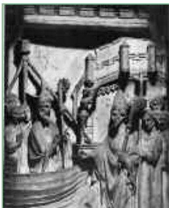
Saint Amand accueille saint Seurin arrivant à Bordeaux en bateau, bas-relief d'albâtre de l'église Saint-Seurin, XVIe siècle