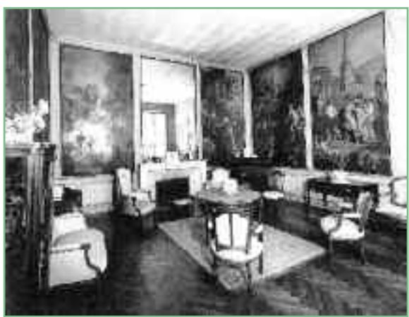
Mirande, Salon des Amours

Les maisons de campagne qui parsemaient autrefois le territoire de Caudéran pouvaient s'apparenter à de somptueuses villas : Mirande et Quadrille en sont deux bons exemples. En 1753, le négociant Abraham Miranda acheta un petit bien dans le bourdieu d'Artigue-Vieille qui prit le nom de Mirande lorsque la demeure fut entièrement reconstruite par un autre négociant : Jean-Pierre Labat de Serene. Si l'édifice est remarquable par ses extérieurs d'un néoclassicisme affirmé, il l'est aussi de par ses intérieurs : les salons de la maison abritent les œuvres d'un jeune peintre palois de passage à Bordeaux : Jean-Baptiste Butay qui déploie notamment dans le salon des amours tout l'attirail des mythologies galantes chères au XVIII e siècle.