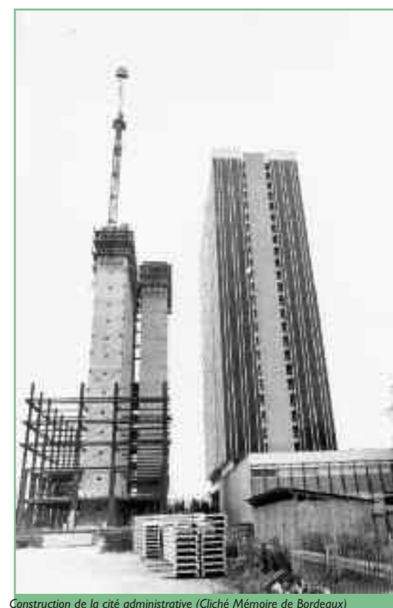
Construction de la cité administrative

Mais ne reste-t-il pas encore un petit air de campagne à cette ville ? Il semble bien que si lorsque, au détour d'une ruelle tortueuse, d'un carrefour, on aperçoit une villa, une haute frondaison, le pignon d'une modeste maison vigneronne ou la façade luxueuse d'une chartreuse derrière la grille d'un parc. Tous ces précieux indices nous rappellent combien, même si la structure du territoire a été profondément modifiée, il reste à Caudéran de nombreux éléments qui en perpétuent le souvenir.