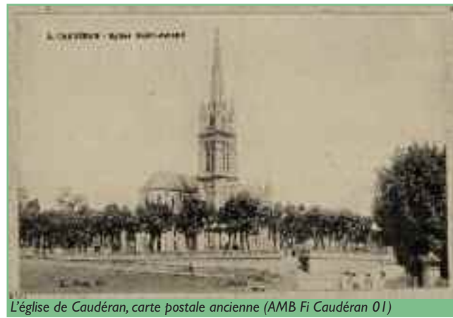
L'église de Caudéran, carte postale ancienne (AMB Fi Caudéran 01)

A l'emplacement de l'ancienne usine à gaz qui jouxtait le cimetière protestant et, non loin, la pépinière municipale où fut transférée l'école d'équitation qui devint la piscine Judaique, deux ensembles de bâtiments singuliers ont pris place. Le premier fut la caserne de la gendarmerie nationale, vers 1900 ; le second fut la cité Bouguereau, l'une des premières réalisations municipales de la reconstruction. Étudié dès 1926 par Jacques d'Velles, l'architecte municipal, le projet passa ensuite dans les mains de Raoul Jourde