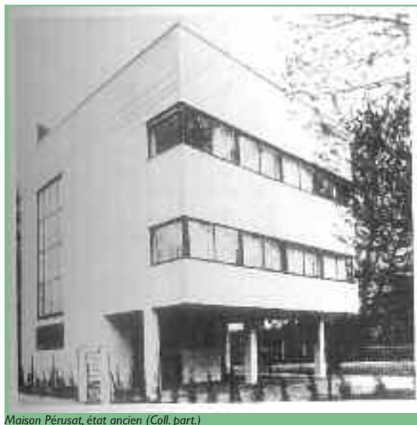
Maison Pérusat, état ancien