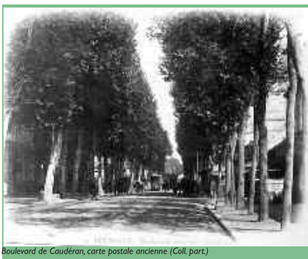
Boulevard de Caudéran, carte postale ancienne

Le développement des établissements de plaisance très nombreux dans la banlieue de Bordeaux depuis la fin de l'Ancien Régime conduisit la ville à redéfinir les marges de son territoire communal et ses limites d'octroi. Vers 1830, il y avait à Caudéran 70 cabarets ou auberges. En 1853, décision fut prise de bien séparer ces établissements de la ville centre mais en réalité de nombreux lui furent intégrés. La création du boulevard de Caudéran (aujourd'hui boulevard du Président-Wilson), dans les années 1860, entre le chemin d'Arès et le chemin d'Eysines, attira très vite une foule d'habitants et de constructions nouvelles, sur ses deux rives et même au-delà. Loin de réfréner l'étalement périphérique, une ville nouvelle se structura au long de ses boulevards et notamment de celui de Caudéran qui abrite quelques-uns des plus beaux hôtels particuliers (grands ou petits), construits alors par la bourgeoisie bordelaise.